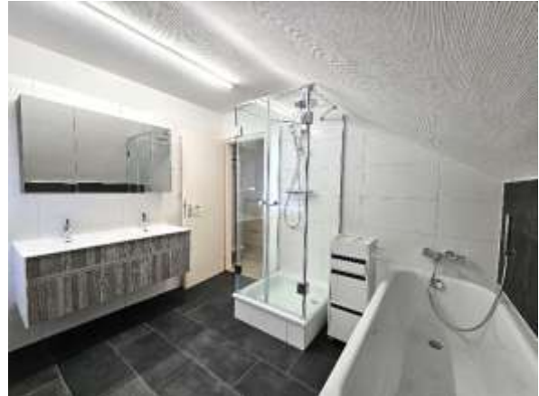
Bad mit Doppelwaschtisch, Dusche, Badewanne, Waschmaschine