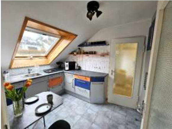
Küche mit Kaffeemaschine, Kochplatten, Kühlschrank, kleiner Sitzgelegenheit