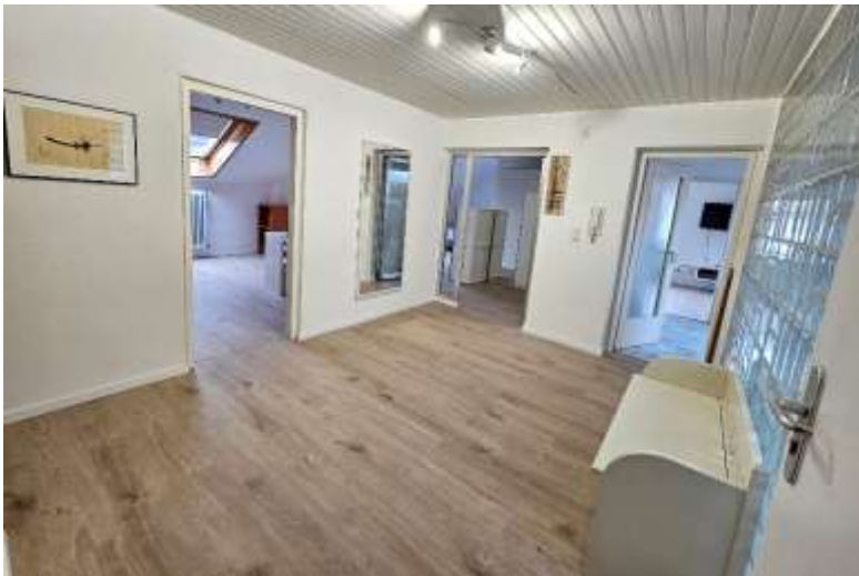
Flur mit Holzbank