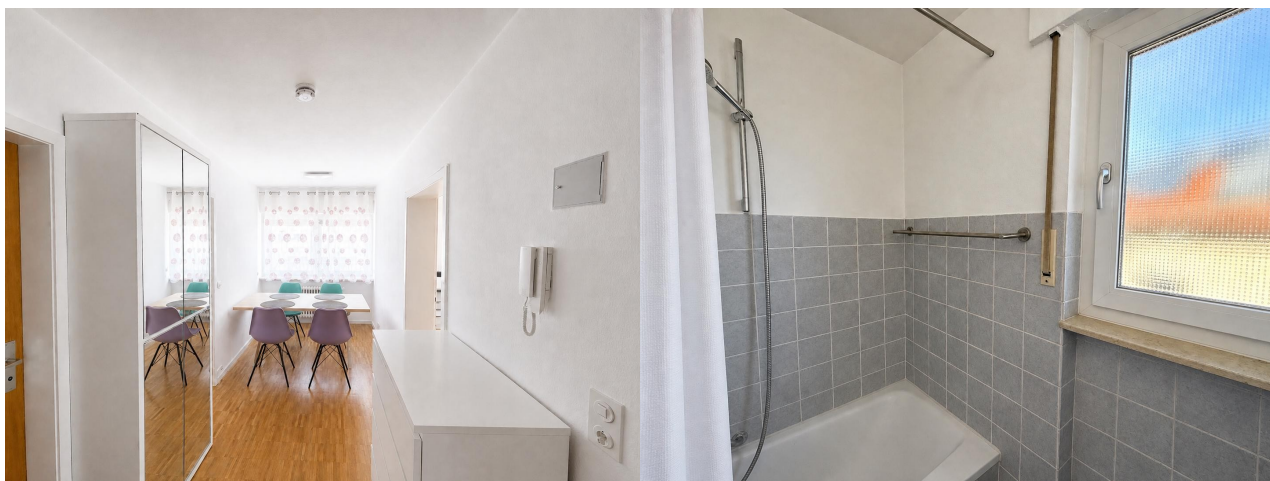
Essbereich / Flur