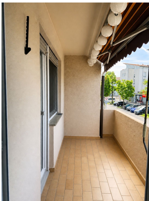
Balkon mit Markise