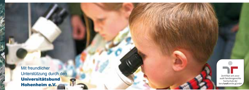
Mit freundlicher Unterstützung durch den Universitätsbund Hohenheim e.V.