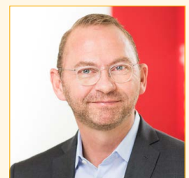
Frank Werneke ver.di-Vorsitzender

kann übrigens auch jedes neue ver.di-Mitglied. Ein verdammt guter Grund also, um nochmal ordentlich die Werbetrommel zu rühren. Sprecht mit Euren Kolleg*innen in Betrieb oder Dienststelle über den erreichten Abschluss in schwierigen Zeiten und macht ihnen klar, wie wichtig Engagement und Solidarität sind! Denn zusammen geht mehr!